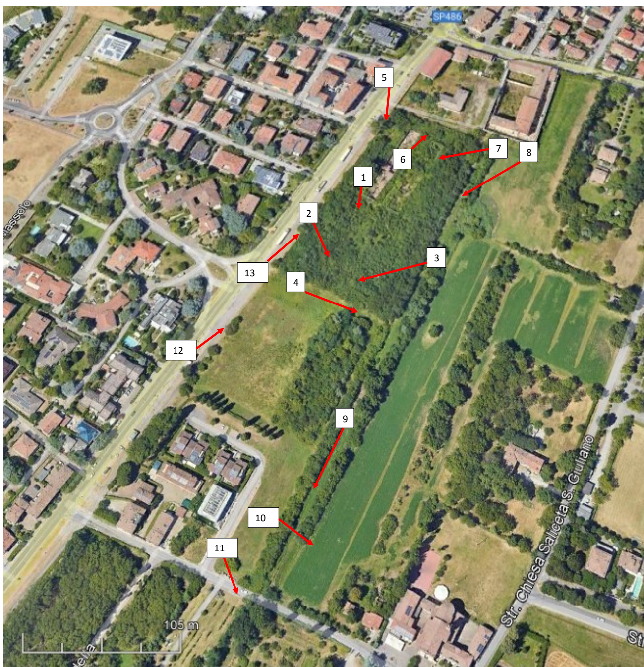
Planimetria di inquadramento